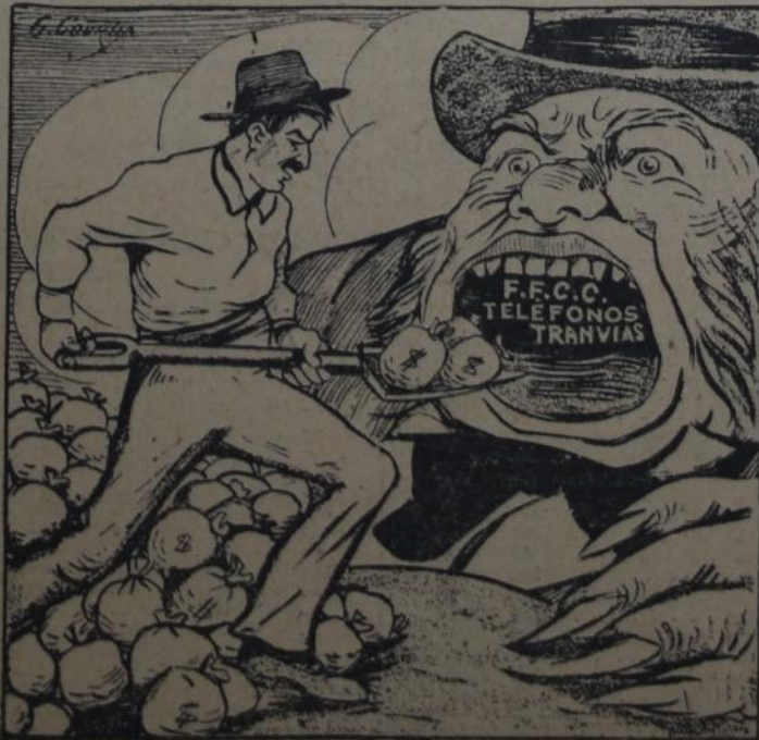
Y SIEMPRE PIDE MAS!